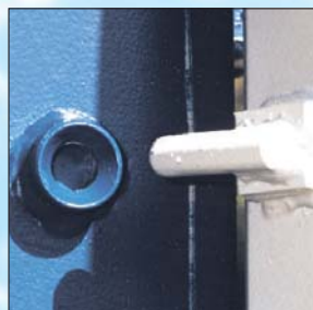
4 proteções internas anti-roubo