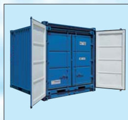
Exemplo de um conjunto contentor-armazém (LC 10' + 8')