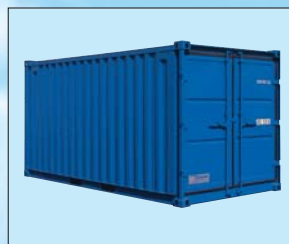
Tipo LC 15'