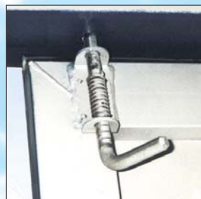
2 dispositivos de fecho interno galvanizados