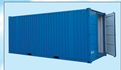
Tipo LC 20'