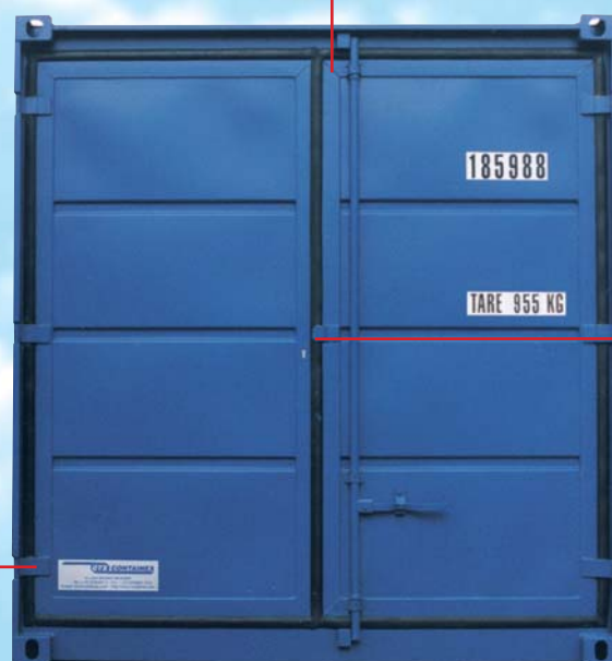
contentor-armazém com equipamento de segurança