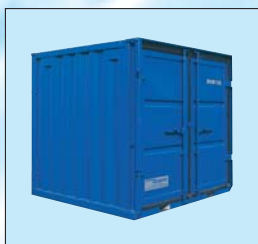
Tipo LC 6'

Contentores-armazém com equipamento de segurança, disponíveis nos tamanhos 6', 8', 10', 15' e 20':